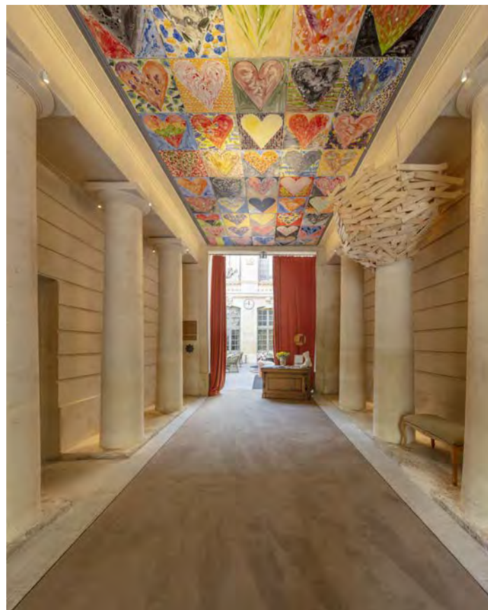
Hôtel Richer de Belleval

En réunissant tous les savoir-faire pour investir dans les territoires, valoriser leur attractivité et soutenir l'innovation, nous proposons un modèle unique et des solutions sur-mesure visant à créer du lien social et du « mieux vivre ensemble » dans une société qu'il nous faut mieux partager .